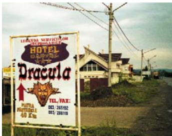
© Christian Merlihot, Voyage au pays des vampires , 2001.

Christian Merlihot est cinéaste ( Chronique des Love-hôtels au Japon et Silenzio ). Il est fondateur de pointlignepan , collectif qui situe ses enjeux au croisement des arts plastiques et du cinéma. Depuis 2002, il est responsable pédagogique du Pavillon , laboratoire de création du Palais de Tokyo.