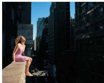
© Laurent Montaron, Spit , 2004.

Laurent Montaron a participé à l'exposition Subréel au MAC de Marseille et a présenté ses derniers travaux à La Galerie de Noisy-le-Sec en janvier 2006.