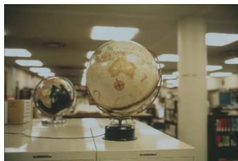
© Allan Sekula, Waiting for Tear Gas (White Globe to Black) , 1999-2000.

« Depuis le début des années 70, dans un double mouvement de lutte contre les déficits de représentation et de résistance face à l'artificialisation de l'activité artistique, Allan Sekula a développé un travail salubre d'examen méticuleux des réalités économiques, politiques et sociales à l'ère de la mondialisation. Ses travaux théoriques couplés à ses enquêtes photographiques ont permis une réinvention de la forme documentaire en art, notamment en politisant son discours. Face aux falsifications de la réalité par les médias de masse, il s'agit d'affirmer qu'il n'y a pas d'autre objectivité qu'une objectivité artistique. »