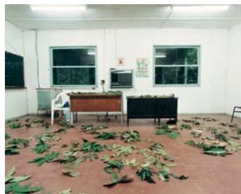
© Sanna Kannisto, Diversity , Duke Reserve, Brésil, 2000.

« Après avoir répondu à une fonction descriptive et un ensemble de critères formels définis durant l'entre-deux-guerres, l'esthétique documentaire apparaît aujourd'hui comme un réceptacle par défaut d'un ensemble de travaux dont l'ambition est souvent de faire apparaître l'Autre. Devant la diversité des travaux qui convoquent cette notion (Harald Fernagu, Sanna Kannisto, Dominique Auerbacher, Olivier Zabat, Justine Triet, Anri Sala, Stéphane Couturier, etc.) on ne peut que constater la difficulté de faire désormais de l'esthétique documentaire un objet théorique.