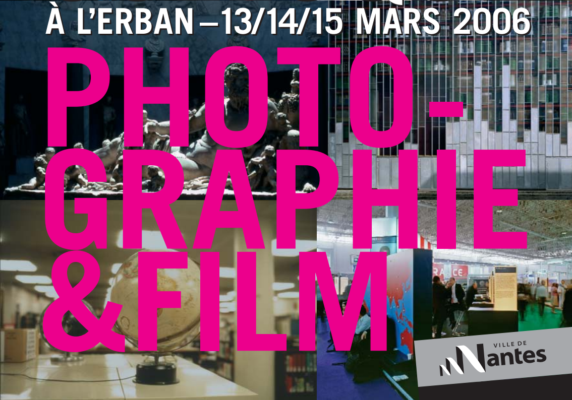
PHOTO- GRAPHIE & FILM