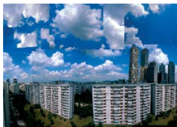
© Kolkosz, Kolkosz Tower , Séoul, Yoido.

Kolkosz est un duo d'artiste qui met régulièrement en jeu des technologies détournées de leur utilisation première pour révéler des frontières entre une réalité tangible et une autre simulée. Touristes est le titre donné à leur catalogue qui clôturé le projet photographique des Kolkosz Towers , sorte de tour rivale virtuellement implantée dans les quartiers d'affaires, et Les Films de vacances , re-modélisés en 3D. Kolkosz participe à Notre histoire au Palais de Tokyo, et ouvrira une exposition en mars 2006 à la galerie Perrotin, Paris.