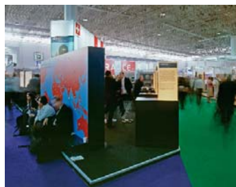
© Bruno Serralongue, What's behind the Information Society, ICT for All, Business Sector, Kram Palexpo , Tunis, 2005, Courtesy Air de Paris, Paris.

Il participe à Notre histoire au Palais de Tokyo, Paris (janvier–mai 2006) et ouvrira une exposition personnelle en mars 2006 au Centre photographique d'Île-de-France.