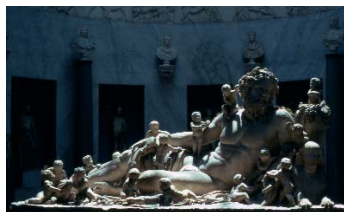
© Rainer Oldendorf, The Nile (...) , Rome, 9 June 1979.

Projection de Marco 6 – 10 roughcut (prémontage VO/DVD/58' / 1998-2006). Marco est comme un film continu en plusieurs épisodes qui se suivent, dont Rainer Oldendorf termine actuellement le deuxième volet qu'il nous présente alors en version de travail en cours. Si Marco se joue entre mise en scène, réappropriation cinématographique et documentaire, selon les périodes de tournage, il n'en témoigne pas moins d'une certaine génération politique propre à l'Allemagne contemporaine, pour ne pas dire proche de l'artiste.