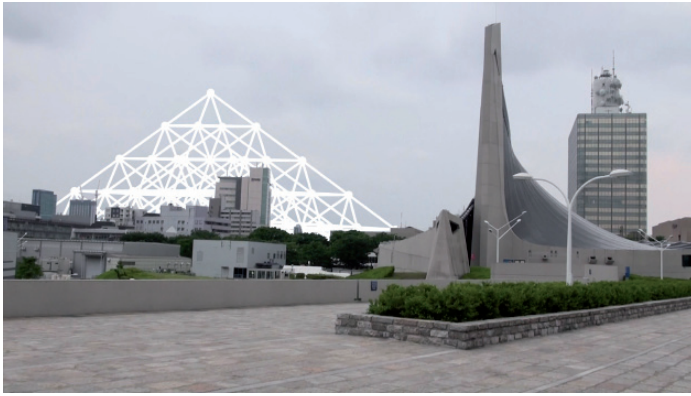
Ghost Tokyo, image extraite de la vidéo, 2013 © Benoit Broisat

S'il fallait prendre les guides touristiques au mot et voir dans les « attractions » que constituent l'acropole d'Athènes, l'Empire State Building ou les chutes du Niagara des corps massifs qui, semblables aux étoiles, attirent irrésistiblement à eux la foule des touristes, celles qui m'ont conduit au Japon se compareraient davantage à cette matière noire, invisible, inobservable, que trahit précisément l'intensité de son pouvoir d'attraction.